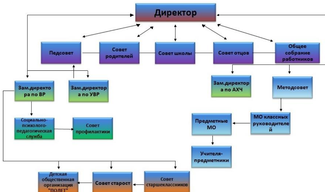
Структура управления ОО

Система управления школой за последние три года не претерпела структурных изменений. Продолжил работу Совет отцов, сократилось количество методических объединений за счет соединения разных предметников, отмечаются качественные изменения, связанные с увеличением доли участия родителей и учащихся в управлении школой через Совет школы, Совет родителей, родительские комитеты классов, Совет старшекласников и др.